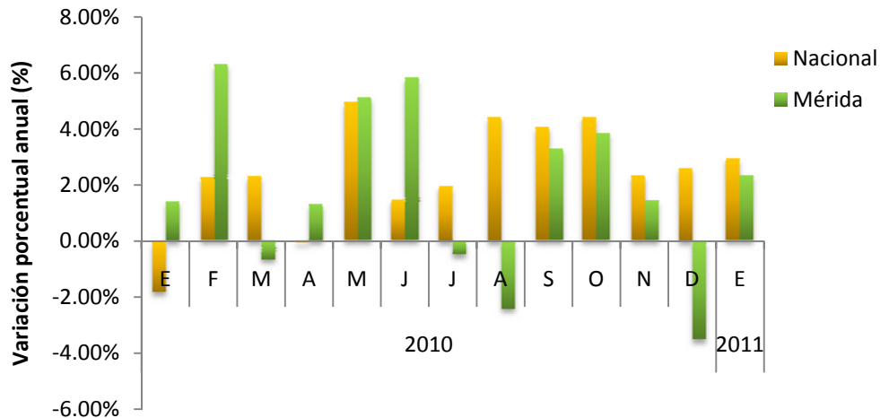
GRÁFICA 2 VENTAS AL POR MENOR EN ESTABLECIMIENTOS COMERCIALES (2010-2011)

Fuente: Secretaría de Fomento Económico con datos del INEGI. Encuesta Mensual sobre Establecimientos Comerciales.