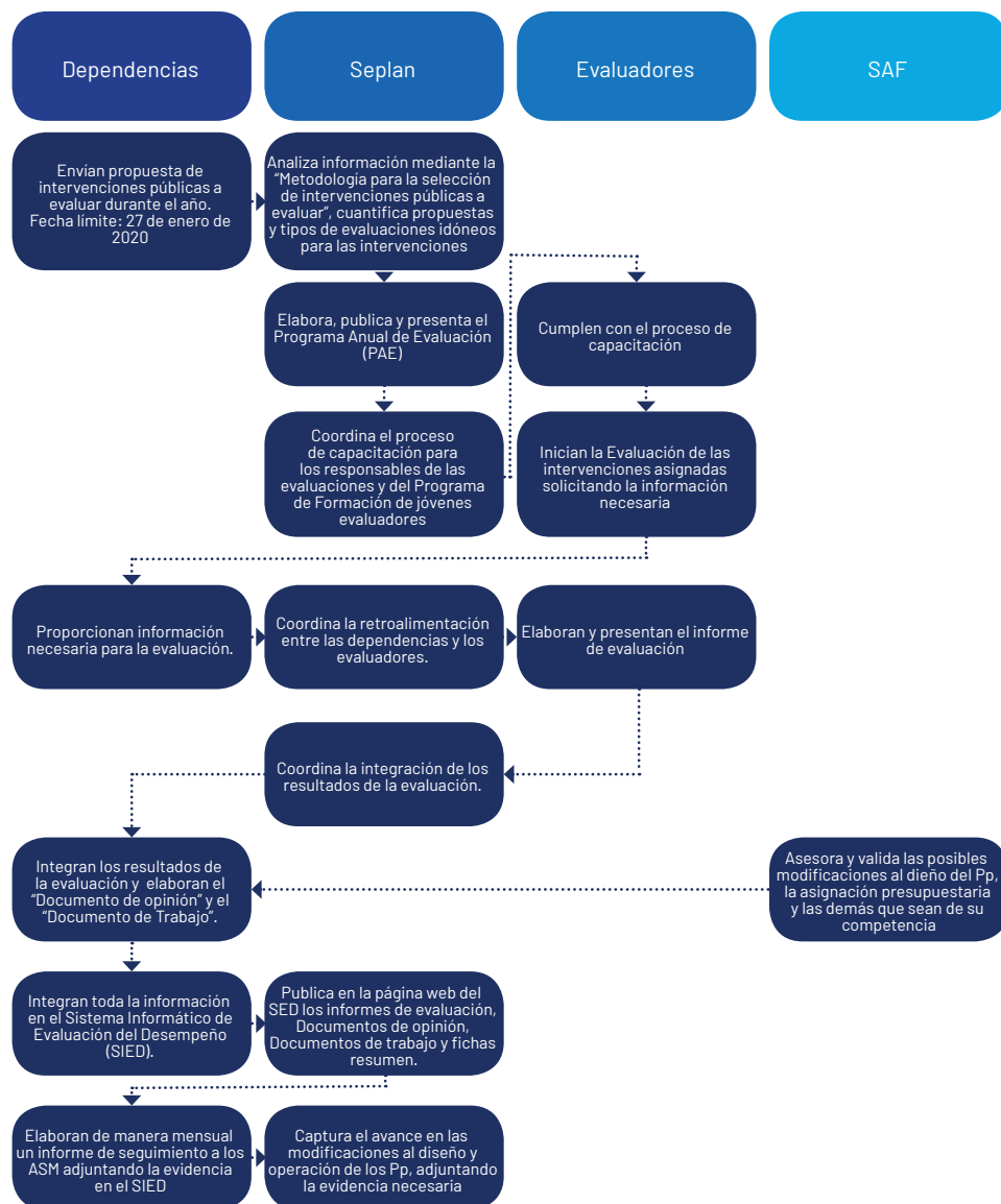
Ilustración 4. Proceso de evaluación

El proceso de evaluación para el estado de Yucatán, se realiza a través de la implementación del ciclo de la evaluación, el cual se desarrolla de la siguiente manera: