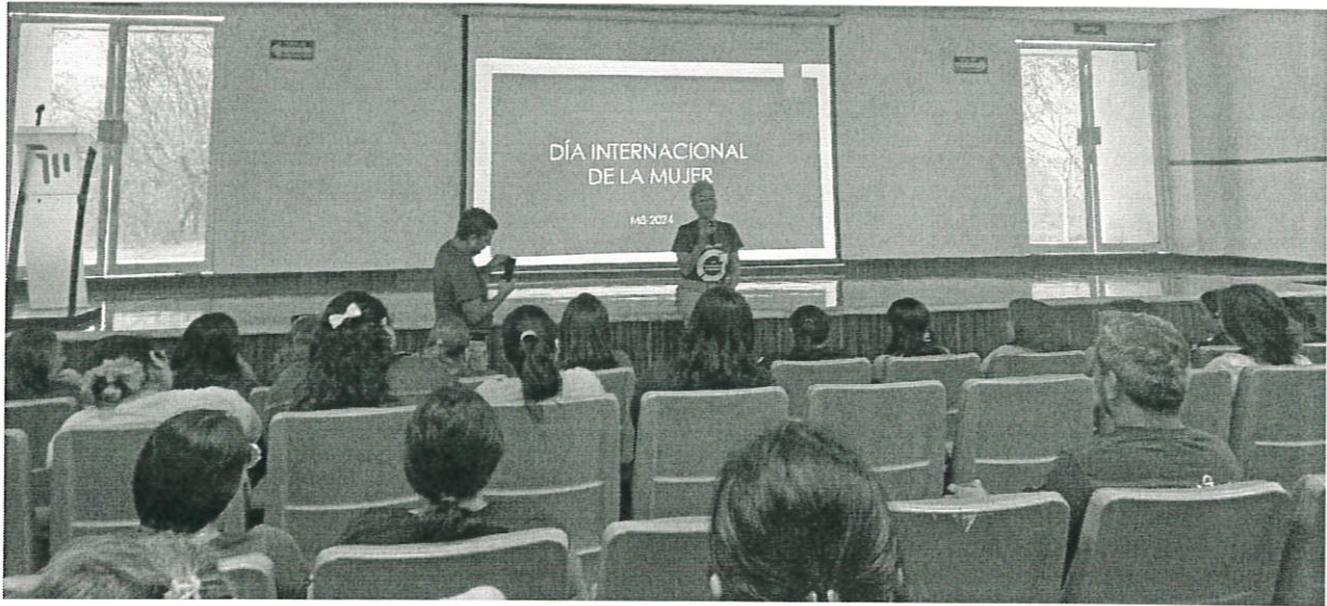
Actividad de foro por el día Internacional de la Mujer 8 de Marzo.

[Handwritten signatures in blue ink, arranged vertically on the right side of the page.]